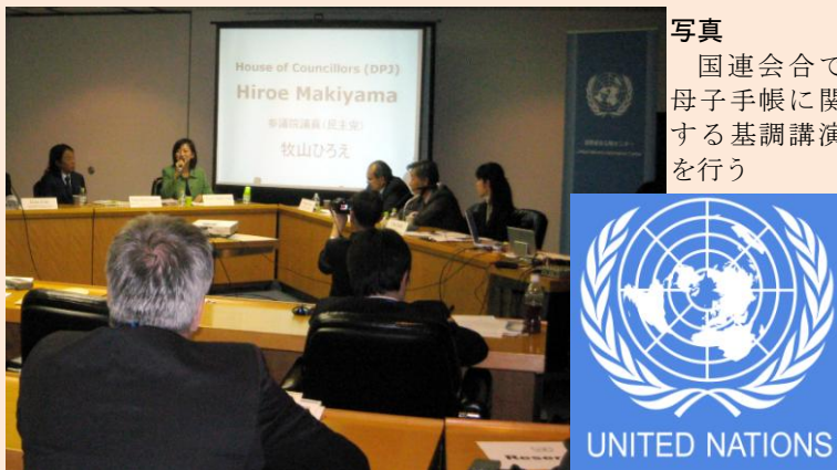
写真 国連会合で母子手帳に関する基調講演を行う